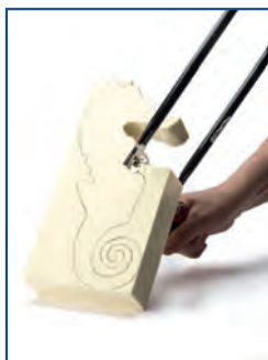
Fase 1 : tagliare