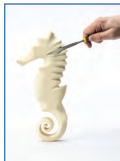
Fase 2 : sagomare