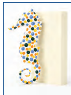
Fase 3 : dipingere